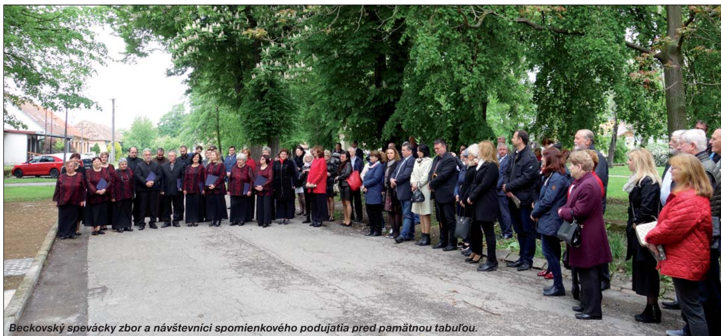
Beckovský spevácky zbor a návštevníci spomienkového podujatia pred pamätnou tabuľou.