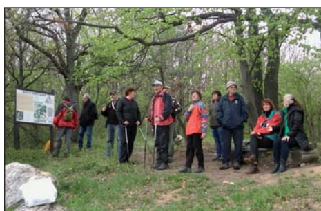
Zastávka pri orientačnej tabuli