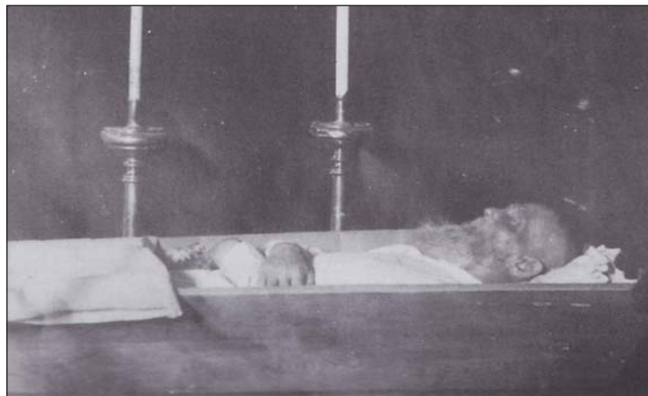
Ladislav Mednyánszky na katafalku.

Poznámky: 1) Denníky 1877 - 1918. Kalligram BA 2006; 2) Mednyánszky. SNG a Slovart, BA 2004; 3) Zsófia Kiss_Szemán, Slovenské moderné umenie. Galéria Nedbalka, 2014, 392 s.; 4) Ladislav Saučín, Z novších výtvarných dejín Slovenska. VSAV Bratislava 1962, 39 - 142 s.