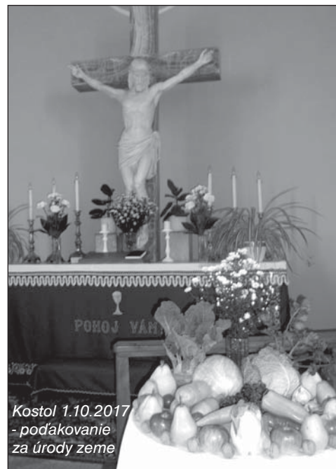
Kostol 1.10.2017 - poďakovanie za úrody zeme