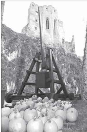
Tekvicový festival na Beckovskom hrade 23. - 24. 9. 2017.

Ak chceme dopestovať najväčšie a najkrajšie tekvice, potrebujeme slnečné miesto. Najlepšie sa im darí na kompostovisku či hnojisku. Pestujeme ich z prísad a sadíme von po „zmrzlých“ svätých, teda koncom mája. Ak pravidelne polievame, najlepšie navečer, tak v septembri - októbri zberáme aj niekoľko kilových obrov. LP