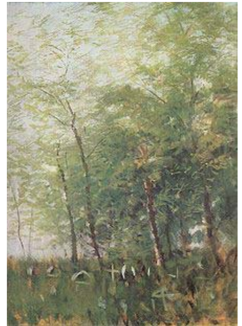
Ladislav Mednyánszky: Cintorín v lese.

pohreb klasicky, ako ho poznáme dnes, symbolika ohňa sa preniesla do sviečok, ktoré napríklad etnickí Huculi (Rusini, Ukrajinci) dávajú do rúk umierajúcemu, v blízkosti domu, pri ceste dokonca zapálili vatru, ktorá horela pokým bol umierajúci v dome. Tých zvykov, ktoré sprevádzali fenomén smrti a ktoré sa koncentrujú v tomto období, je naozaj neúrekom a analógie v spojení masiek, svetiel, tekvic možno nájsť naprieč celou indoeurópskou tradíciou v Európe (rozumej aj Kelty, Germánov, nie len Slovanov) či už vyhľadávame v slovníkoch pojmy, ako sú Dušičky, Velesova noc, Samhain alebo moderný Halloween. AS