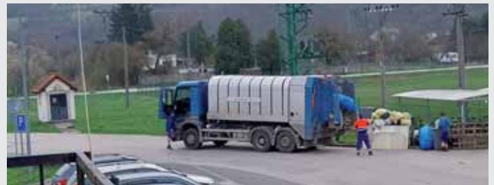
1. Zber KO v obci.