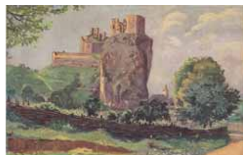
Obr. 1 - 2: Beckovský hrad od Emila Kosu