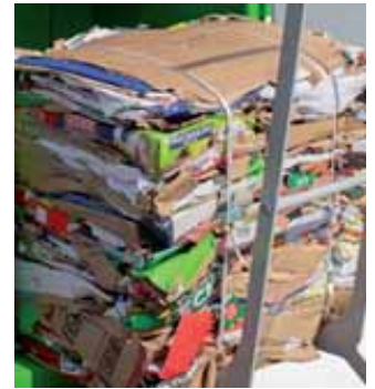
2. Takto ÁNO.

pre naše životné prostredie a pre svoju obec - teda aj sami pre seba.