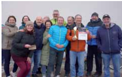
Všetkým zúčastneným ešte raz ďakujeme. RP