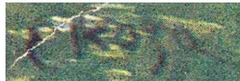
1. E. Kosa - podpis na pohľadnici Beckova

(1900 - 1925). Taktiež datovanie pohľadnice na Slovakiane je nepresné, na rube nie je uvedený rok vydania ani rok namaľovania obrazu, iba v popise sa uvádza: Hrad Beckov - Považie na Slovensku, datovanie 1920 (zrejme rok odoslania pohľadnice), vydalo Krajinárske veľkonákl. umel. pohľad. F. Kocman, Jedovnice. Mor. Kras.