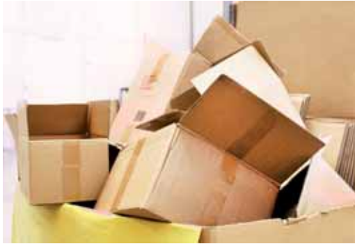
1. Takto NIE.

Niekedy je dosť náročné vysvetľovať tzv. samozrejmosť. Medzi takéto veci v súvislosti so zberom komunálneho odpadu patrí aj separovanie kartónov v podobe škatúl rozličných rozmerov. Napr. krabica od topánok - ak ju poskladáme, zaberie približne 40 cm na dĺžku, 30 cm na šírku a 0,5 cm na výšku. Keď si predstavíme bežnú plastovú prepravku, ktorá má rozmery 60x40x22 cm, čo myslíte, koľko krabíc od topánok do nej umiestnime, keď ich poskladáme a koľko, keď ich vložíme nezložené? Odhadom, pomer bude cca 1:9, teda 10 celých plných krabíc k 90 poskladaným. Približne. ÁNO? Preto vás prosíme, poskladajte svoje kartóny, zviažte ich a až tak odovzdajte na obecnej prevádzke. Urobíte tak dobre