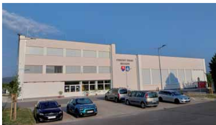
1. - 3. KD po rekonštrukcii 2024.