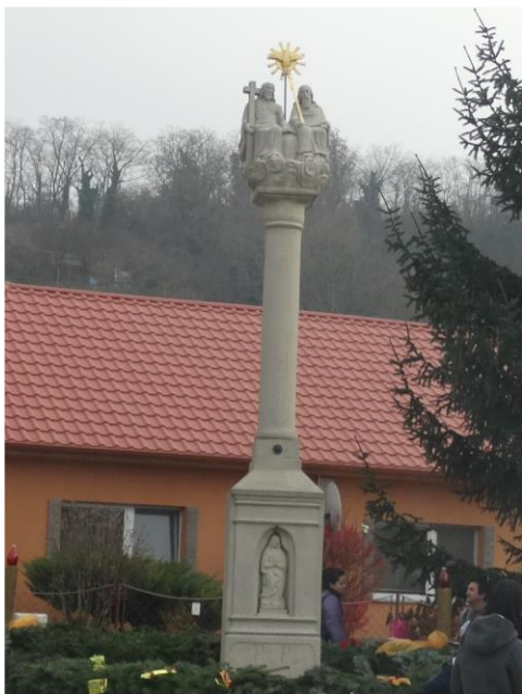
Súsošie sv. Trojice.