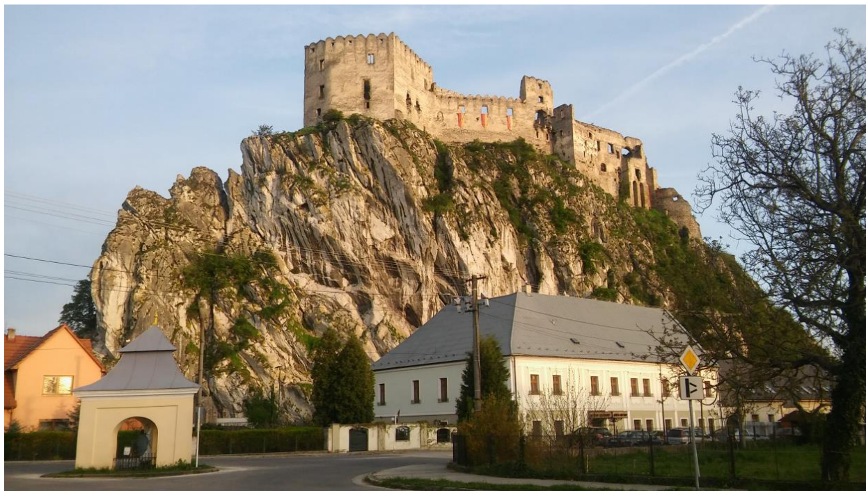
Beckovský hrad – pohľad od bývalej severnej brány, 22.04.2016

Každoročnými dielčimi zmenami v hmotnej podstate NKP sa ciele dosiahnuť vytvorenie nových krytých priestorov v celistvo zachovaných objektoch hradného jadra a formou náznakovej rekonštrukcie zaniknutých hospodárskych objektov sa dosiahne vytvorenie priestorov pre potrebné prevádzkové zázemie hradu a zvýšenie jeho pôvodnej priestorovej čitateľnosti.