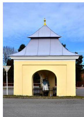
Kaplnka v. Jána Nepomuckého