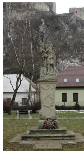
Socha sv. Floriána