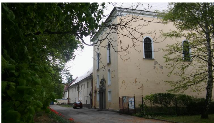
Františkánsky kostol a kláštor